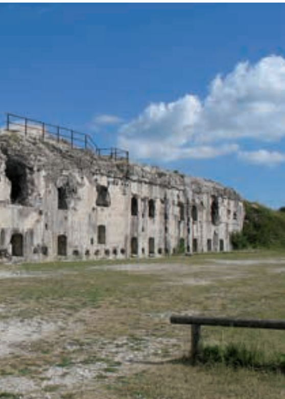
Forte Sommo alto, Folgaria

avuto la possibilità di avvalerci degli splendidi scatti di Mirco Dalprà, un fotografo che di ciascun luogo, ciascun forte, ha saputo cogliere gli aspetti più significativi, sottolineandoli con la sua personale interpretazione artistica. Ci fa dunque piacere pensare che nelle case degli Altipiani entreranno immagini e testi che raccontano un dramma lontano, un conflitto che ci apprestiamo a ricordare, un conflitto che da queste parti ha lasciato tracce indelebili, sul territorio ma anche, e molto profonde, nella memoria della gente”.