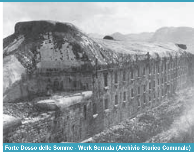
Forte Dosso delle Somme - Werk Serrada

cercando iniziative nuove e possibilmente originali. Nel secondo caso molto dipenderà dalle risorse di cui la Comunità e l'Azienda per il Turismo potranno disporre. Dopo il lungo periodo di assenza istituzionale indotto in autunno dal rinnovo del Consiglio e della Giunta provinciali, nell'ambito del Tavolo di lavoro ci siamo incontrati il 21 gennaio con il nuovo assessore alla cultura Tiziano Mellarini , accompagnato dai suoi tecnici e dai dirigenti di Trentino Turismo. L'assessore ha ribadito che la Comunità di valle è riconfermata quale ente di riferimento e che, data la scarsità delle risorse, qualsiasi evento