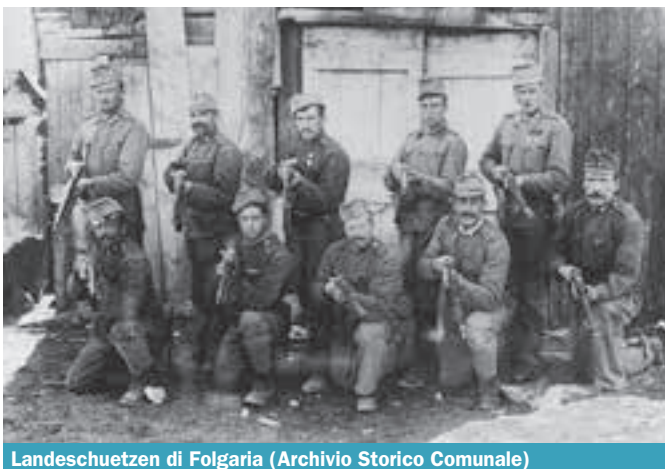
Landeschuetzen di Folgaria